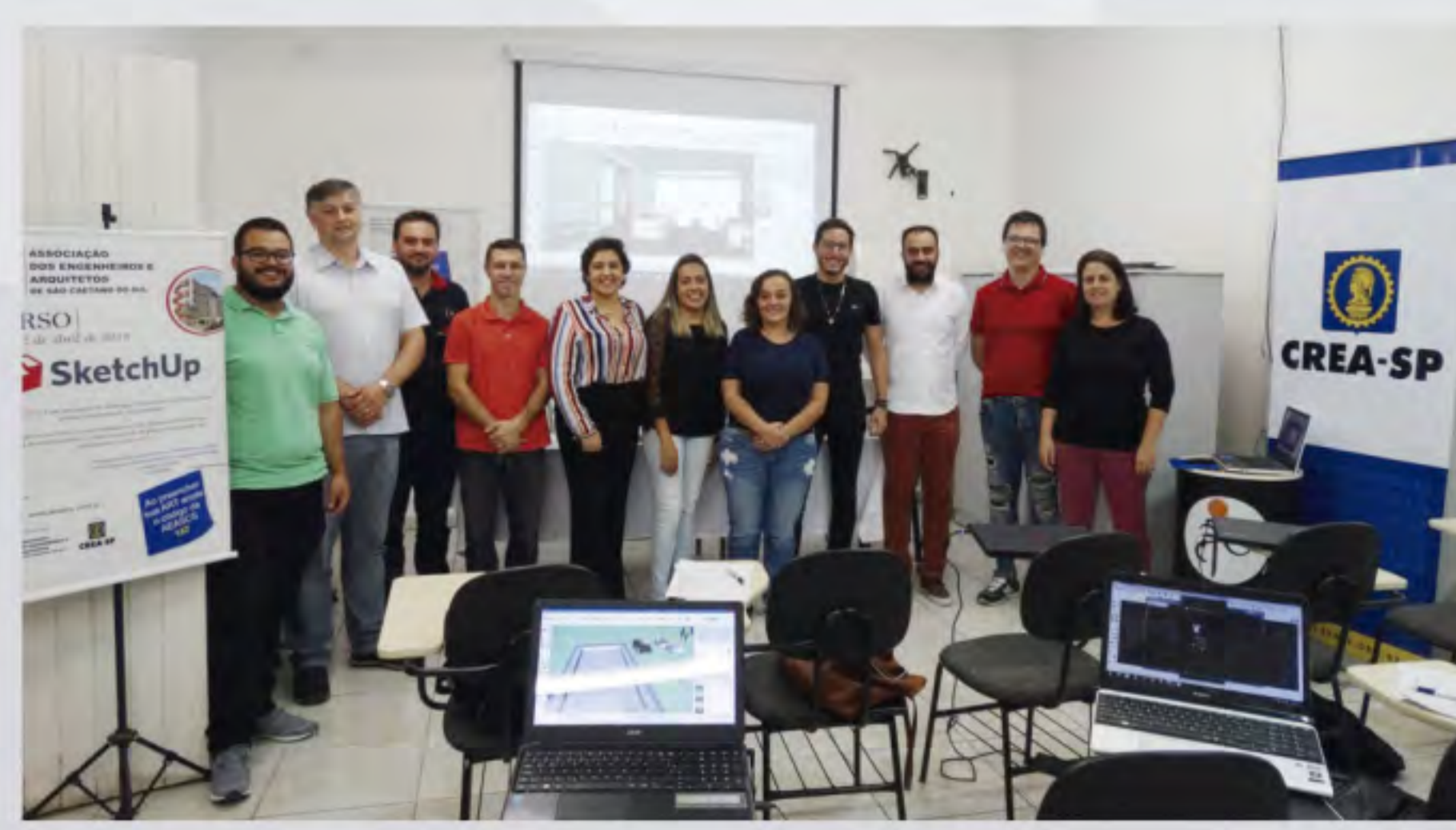
Participantes do Curso de Sketchup

Foi realizada a Palestra "Apresentação da Lei nº 5589/17 que dispõe sobre incentivos a Regularização de Edificações - LIRE" com o Arqº Ênio Moro Secretário Municipal de Obras e Habitação da Prefeitura Municipal de São Caetano do Sul". Tivemos a Participação de Engenheiros e Arquitetos.